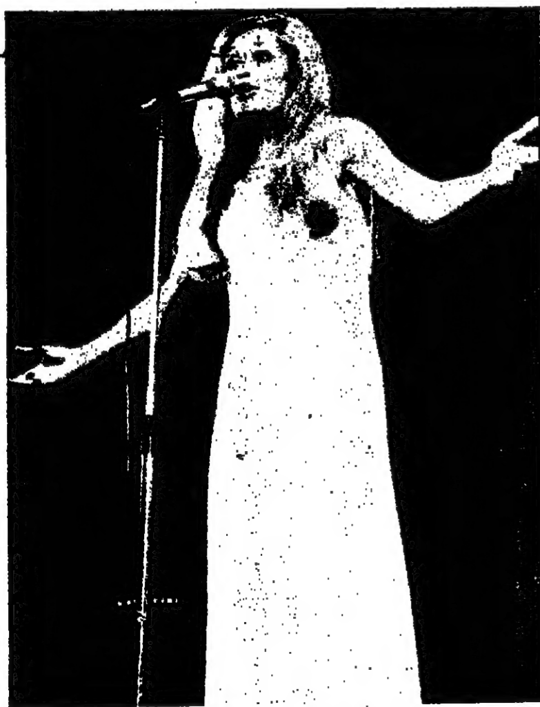
ما زالت تسرق الانظار

عندما تكون النجمة بمستوى داليا ، فإنها تحسب ألف حساب لظهورها امام الناس ..